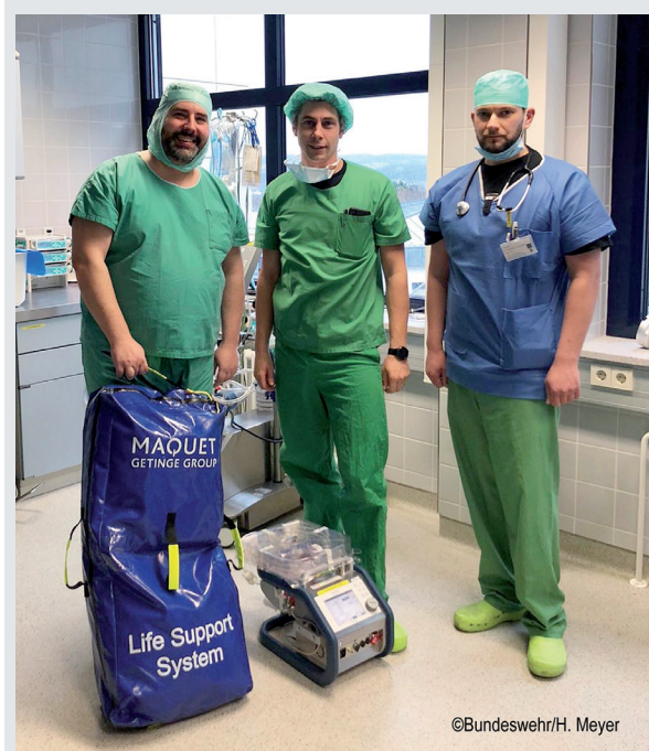
Abb. 2: ECMO-Team mit kompletter Ausstattung (ohne Sauerstoff)